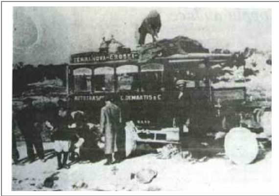
La corriera per Terranova

26 ottobre (Venerdì), con l'idea di prendere il 1° treno del giorno successivo (Sabato 27), e con la speranza anche che si sarebbe potuta avere la riduzione del viaggio per le feste dell'anniversario dell'avvento del fascismo al potere e per la celebrazione dell'anniversario della vittoria (4 novembre). A Nuoro non ci fu possibile ottenere il viaggio con riduzione, e si prese allora, l'automobile per Terranova (Olbia, ndr) nella speranza che, almeno là, si fosse potuta ottenere; ma pur troppo anche qui nulla si è potuto fare, forse perchè non si seppe chiedere. Ma disinteressiamoci di questo che è episodio secondario.