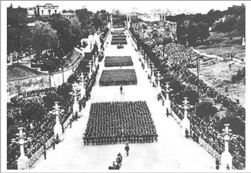
Roma, via dei Fori Imperiali, 1922 circa; La sfilata per la celebrazione della Vittoria