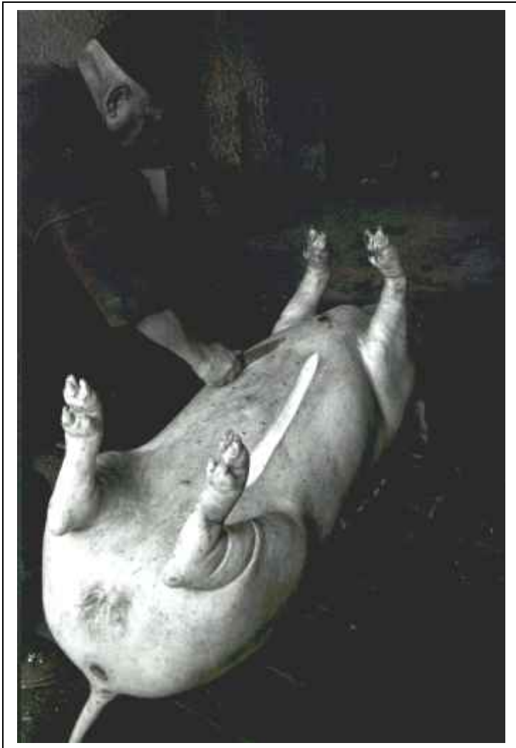
Rito dell'uccisione del maiale: dopo aver bruciato i peli con la fiamma, gli aiutanti raschiano la pelle. Poi il padrone inizia a sezionare con precisione chirurgica.