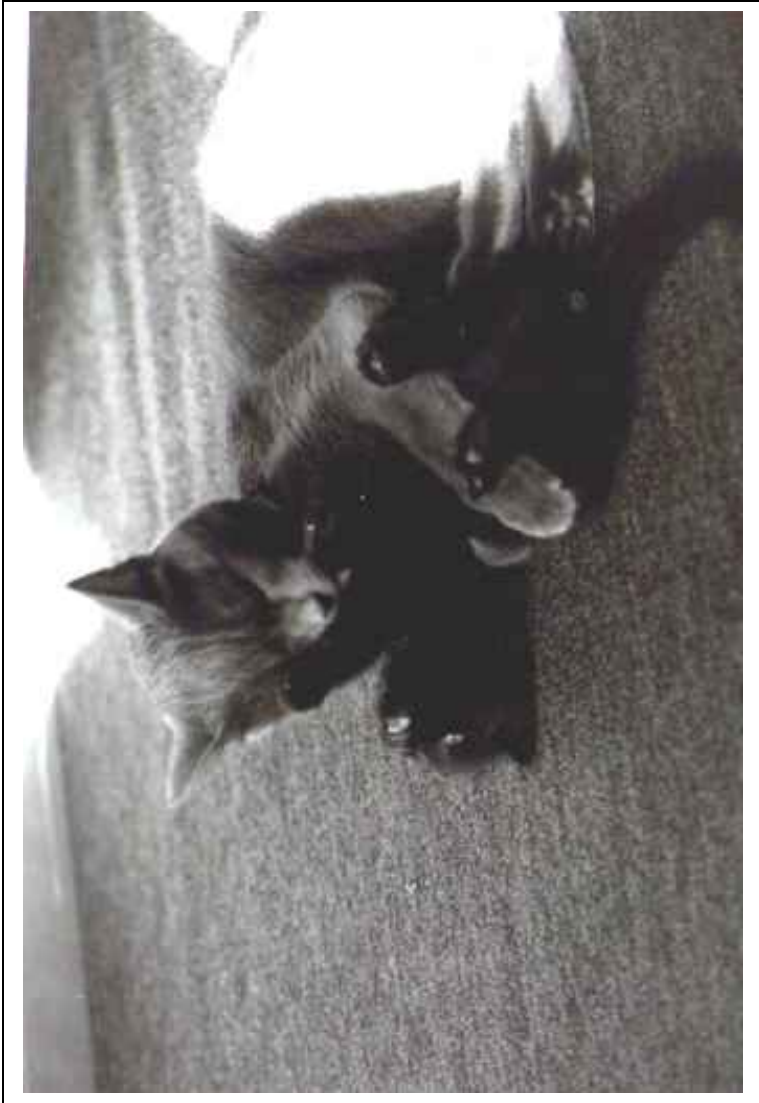
Mindy con Gatto