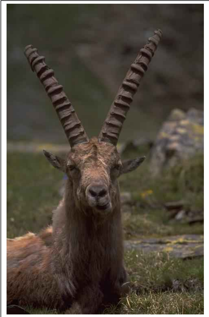
Ritratti di animali maestosi e pacifici. Corna lunghissime, portate con dignità: ogni tacca un anno di vita.