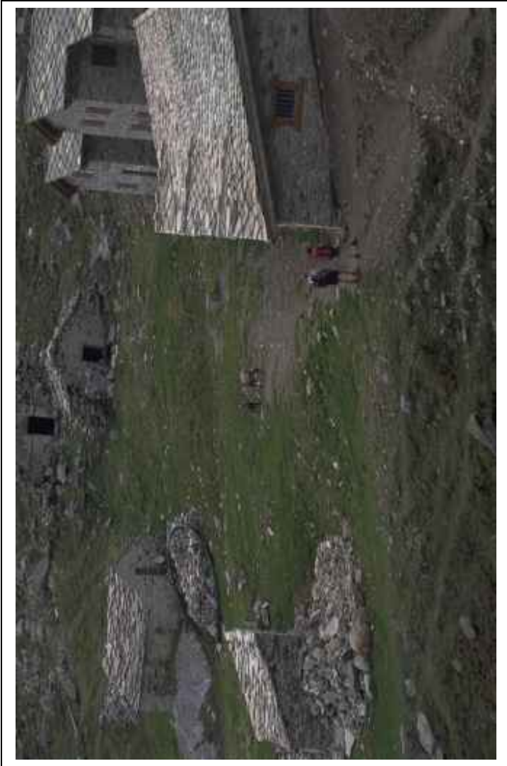
Si incontrarono così, all'improvviso. Quasi al centro dell'ovile